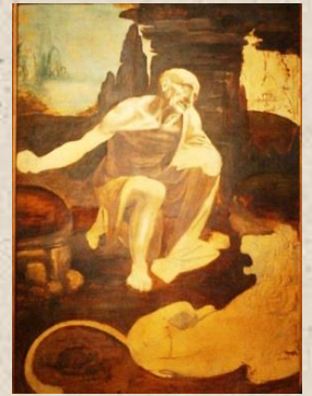
Leonardo da Vinci: Sveti Jeronim

NOVOSTI - elektroničko mjesečno glasilo Društva prijatelja glagoljice iz Zagreba godišće VIII | broj 80 | listopad 2022. | ISSN 2718-4307