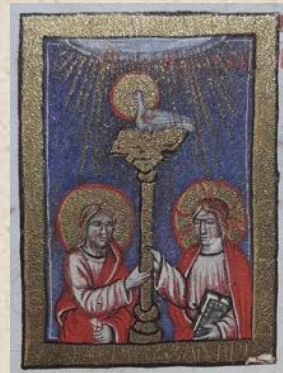
Duhovi - Iluminacija iz Hrvojevog misala

NOVOSTI - elektroničko mjesečno glasilo Društva prijatelja glagoljice iz Zagreba godište VII | broj 77 | lipanj 2022. | ISSN 2718-4307