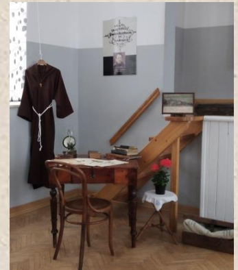
Parčićev kutak osmišljen za predavanje u Vrbniku

Poštovani i dragi članovi, suradnici i prijatelji Društva prijatelja glagoljice!